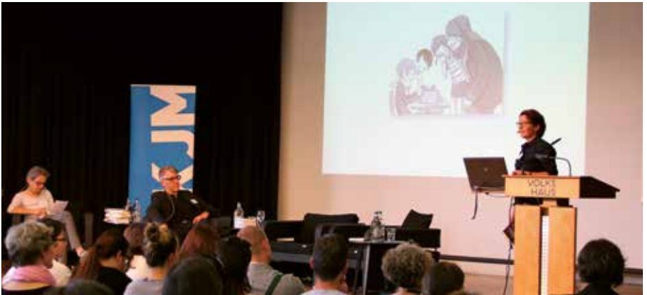
Margit Auer, Autorin der Serie «Die Schule der magischen Tiere», las aus ihrem Werk vor.

An der SIKJM-Jahrestagung am 22. September 2017 setzten sich 190 Personen unter dem Motto «Unendliche Geschichten» mit dem Phänomen Serialität auseinander.