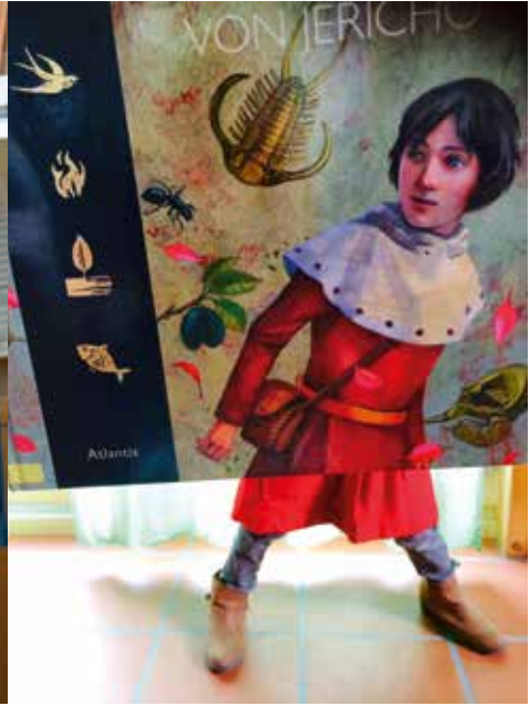
Am Wettbewerb «Mach ein Bookselfie» an der Bündner Bibliothekswoche nahmen über 100 Kinder teil.