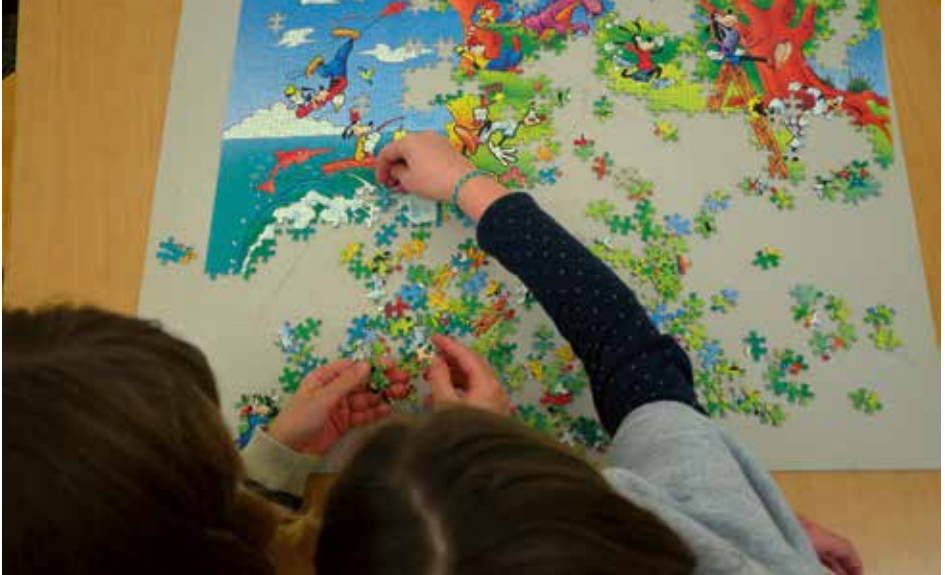
Ein neues Projekt: «Lesefieber» unterstützt Leseanfänger mit Puzzles bei der Leseaktivität.

im August erzählten zwei Studierende des Literaturinstitutes Biel von ihrem Lernen und Schaffen.