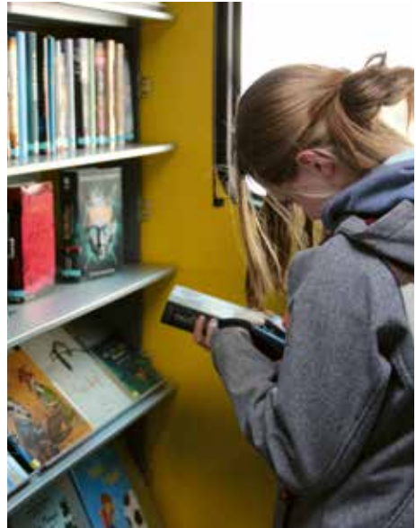
Bücher unterwegs: Jugendliche im Infomobil.