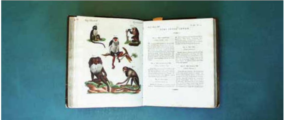
Einer der Schätze aus der SIKJM-Sammlung: Band 3 von F. J. Bertuchs Bilderbuch, erschienen 1798.

Im Laufe des Jahres fanden in der Bibliothek zahlreiche Führungen statt mit, je nach Interesse und Bedürfnissen, unterschiedlichen Schwerpunkten.