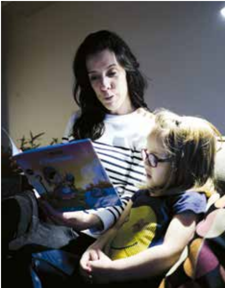
Moment de partage entre une mère et son enfant.

L'année dernière, la démarche pilote menée par l'ISJM en 2015 avec les infirmières de petite enfance de l'Est vaudois, s'est généralisée.