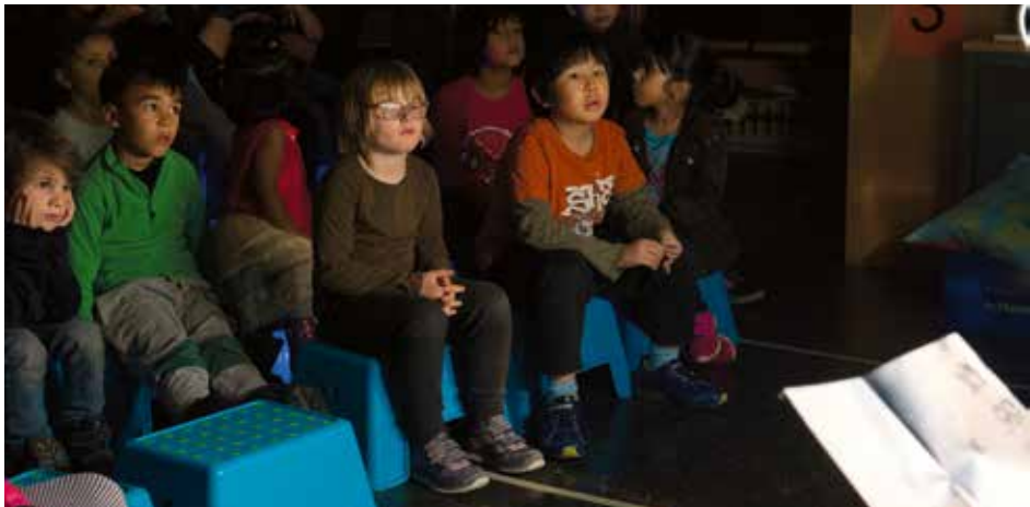
Zur Erzähl Nacht fanden sich mutige ZuhörerInnen in der Schule Im Herrtig in Zürich ein.

Insgesamt wurden dem SIKJM 2017 638 Veranstaltungen gemeldet, davon 424 in der Deutschschweiz. Das Plakat für die Erzähl Nacht gestaltete das Tessiner Illustratorinnen-Duo Officina 103. Getragen wird die Erzähl Nacht vom SIKJM, Bibliomedia Schweiz und UNICEF. Auch 2017 schafften all die Erzähl Nachtveranstaltungen durch das gemeinsame Erleben von Geschichten positive und langanhaltende Leseerfahrungen.