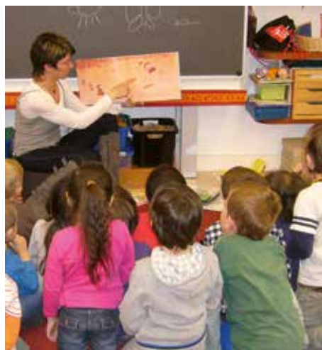
L'animatrice de l'ISJM et son public attentif.

Dans le cadre de cette démarche, les élèves ont l'opportunité de rencontrer un créateur en l'invitant dans leur classe, ce qui leur permet de découvrir ses ouvrages de manière plus