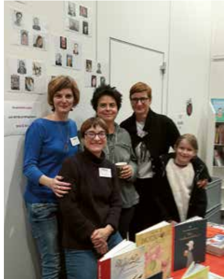
Der AUTILLUS-Stand am ABRAXAS-Festival.

Welche Anlässe AUTILLUS-Mitglieder in die Welt hinaus trugen, konnte 2017 auf unserer Webseite in elektronischen Postkarten nachgelesen werden. Auch bei nationalen Anlässen wie den Solothurner Literaturtagen und dem