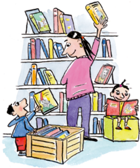
Bibliotheken besuchen: Ein Tipp aus dem Elternratgeber, illustriert von Claudia de Weck.

Wer ein geeignetes Sach-, Vorlese- oder Bilderbuch sucht, kann neu die Medientipps des SIKJM konsultieren: Aus jährlich 9000 deutschsprachigen Neuerscheinungen für