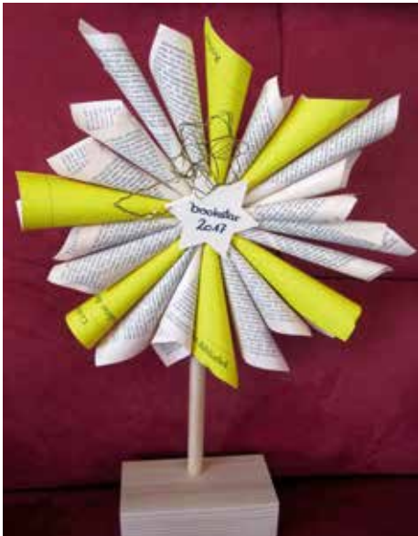
Die «Bookstar»-Trophäe ging 2017 an Kiera Cass.