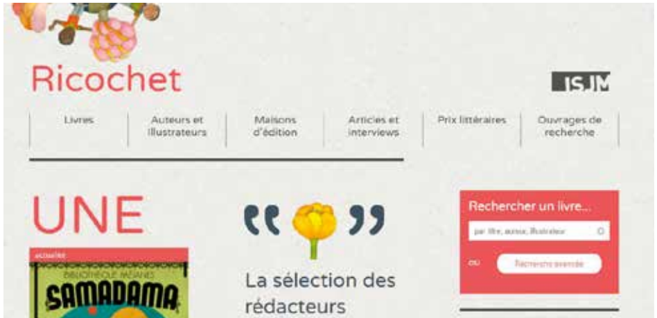
Capture d'écran de la page d'accueil du nouveau Ricochet – www.ricochet-jeunes.org .

Entre la refonte du site, le développement d'outils de communication et la diversification des publications, Ricochet a vécu une année riche en défis.